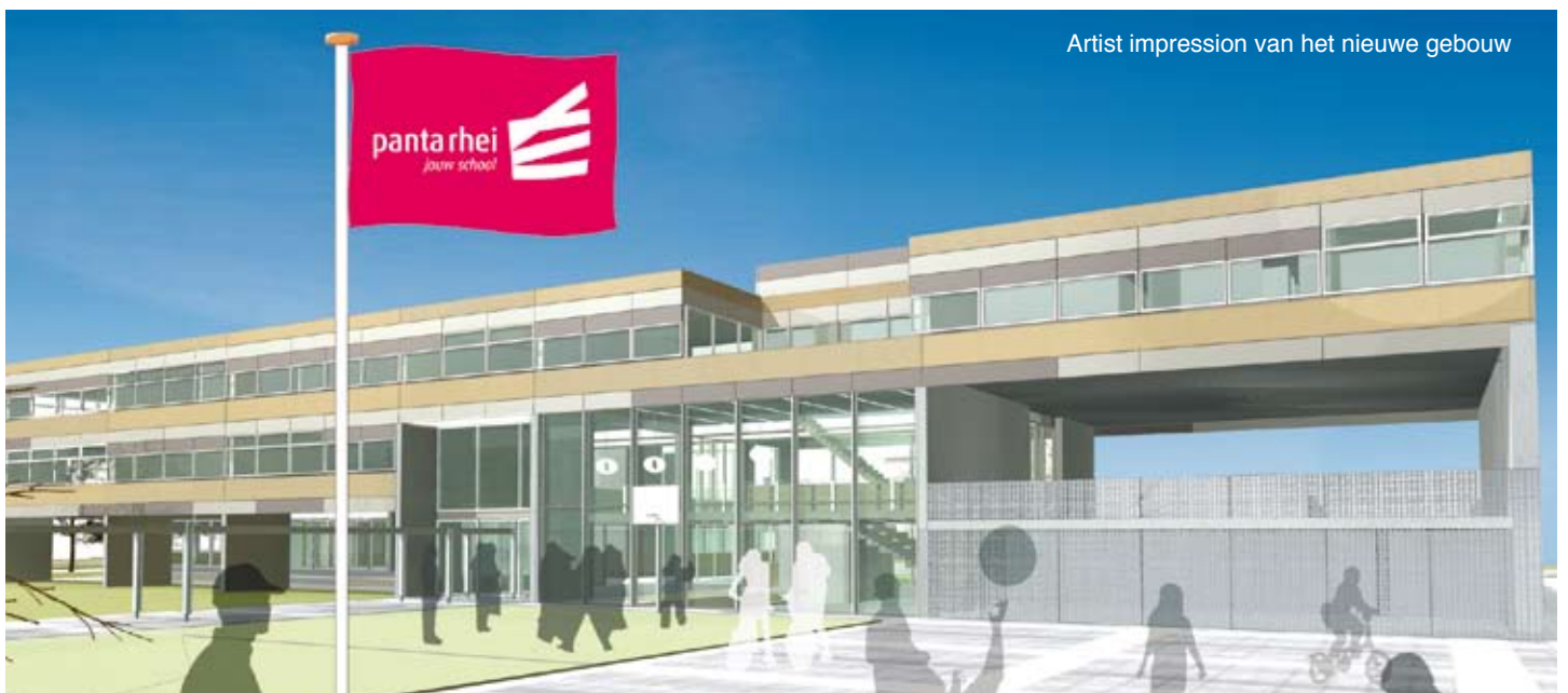
Artist impression van het nieuwe gebouw